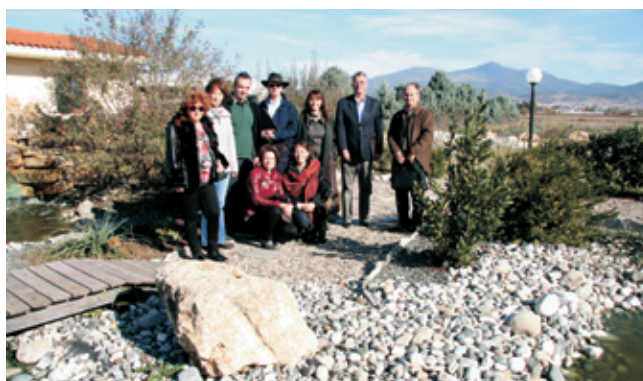
Από την επίσκεψη στο αγρόκτημα του ΕΛΓΟ στη Θέρμη Θεσσαλονίκης.

Το Ινστιτούτο Βάμβακος και Βιομηχανικών Φυτών του ΕΛΓΟ-ΔΗΜΗΤΡΑ έχει συνεχή συνεργασία και επικοινωνία με το ICAC, και συμμετέχει στην οργανωτική επιτροπή διοργάνωσης της 73 ης Συνέλευσης της Ολομέλειας. Η διοργάνωση της