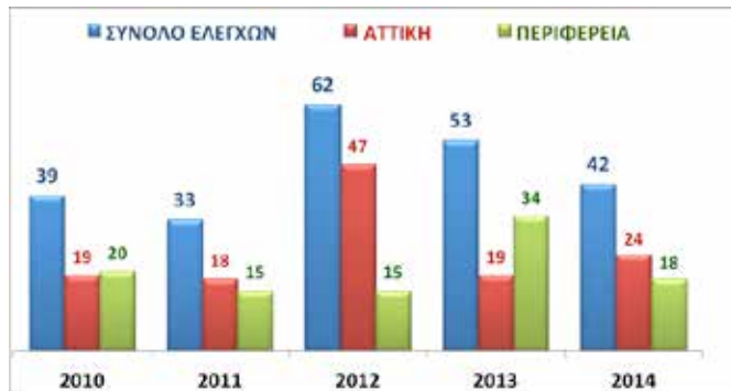
Αριθμός των ελέγχων αγοράς για τα προϊόντα ΠΟΠ & ΠΓΕ 2010-2014